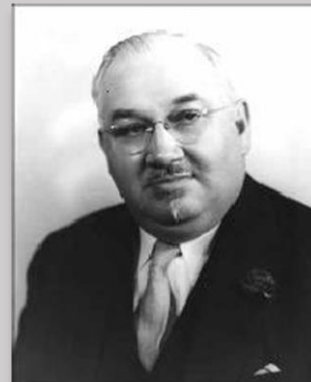
Harvey Spencer Lewis