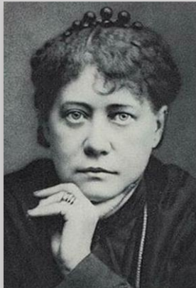
Helena Petrovna Blavatsky

Conocida como Madame Blavatsky, fue una mística y autora rusa y estadounidense que cofundó la Sociedad Teosófica en 1875